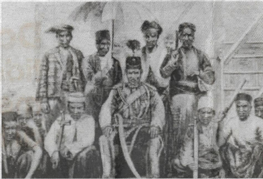
Sultan Abdullah (tengah) bersama Datuk Maharaja Lela (berdiri dari kiri) serta pembesar Perak.

Tokoh yang berjuang habis-habisan hingga dihukum gantung oleh tentera Inggeris