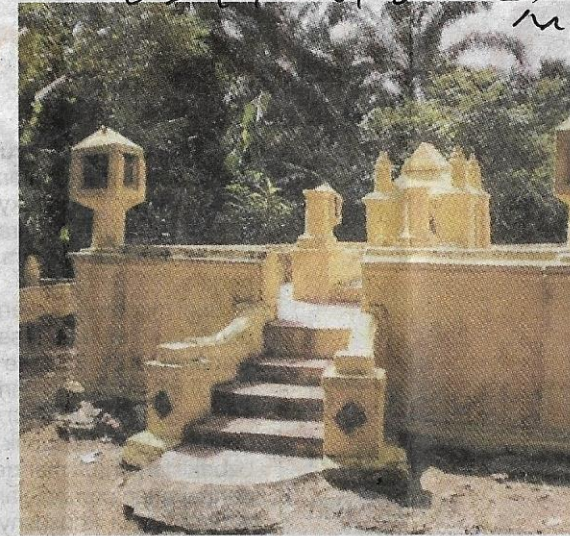
Makam Dol Said yang terletak di belakang Masjid Taboh Naning di mukim Naning.