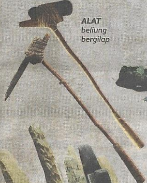
ALAT beliung bergilap