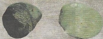
ALAT kerakal dua muka