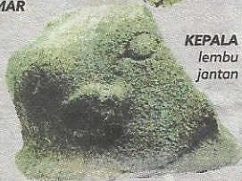
KEPALA lembu jantan