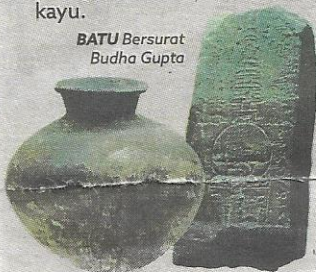
PERIUK tembikar, Kuala Selinsing