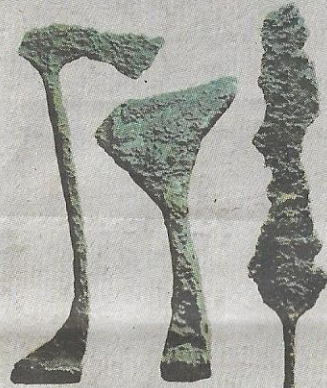
ALAT daripada besi yang dikenali sebagai tulang mawas