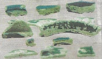
SERPIHAN seramik import jenis kelukuran percik