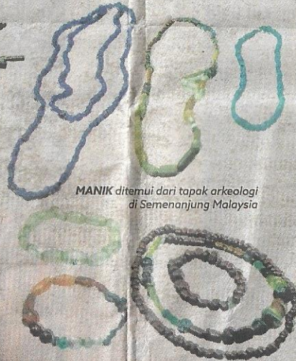
MANIK ditemui dari tapak arkeologi di Semenanjung Malaysia