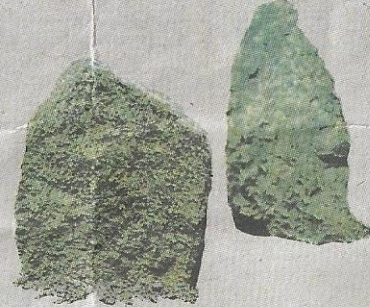
BATU megalit dari tapak megalit Kampung Terachi, Negeri Sembilan