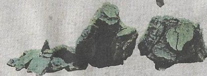
SISA logam (besi)