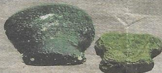
KAPAK batu berbahu