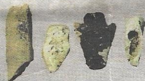
ALAT tulang masyarakat memburu