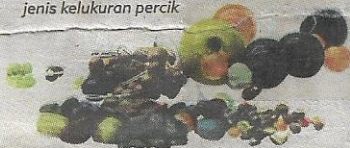
MANIK ini dipercayai barang dagangan dari India