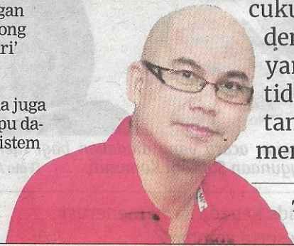
Tentera Gulang, Pesara guru

"Adakah itu satu keperluan yang perlu kami lakukan walaupun tahu kemampuan murid pada waktu sukar (pandemik) selama dua tahun. Saya cukup sedih dengan keadaan murid berdepan kesukaran sewaktu Pembelajaran dan Pengajaran di Rumah (PdPR), tiba-tiba semua data perlu nampak 'baik' sahaja," katanya.