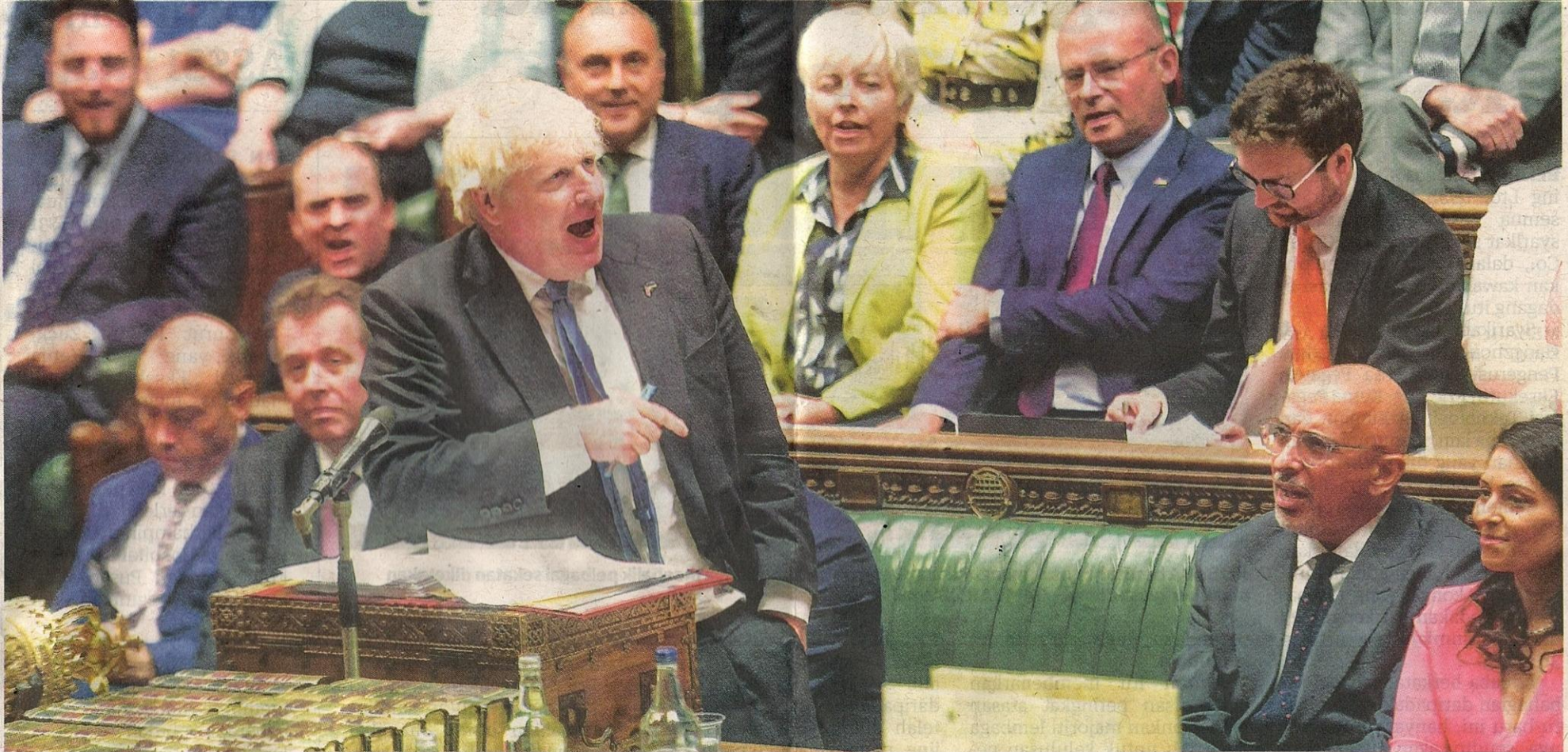
BORIS Johnson bercakap pada sesi Soal Jawab Perdana Menteri (PMQ) terakhir di Parlimen di London pada 20 Julai lalu.