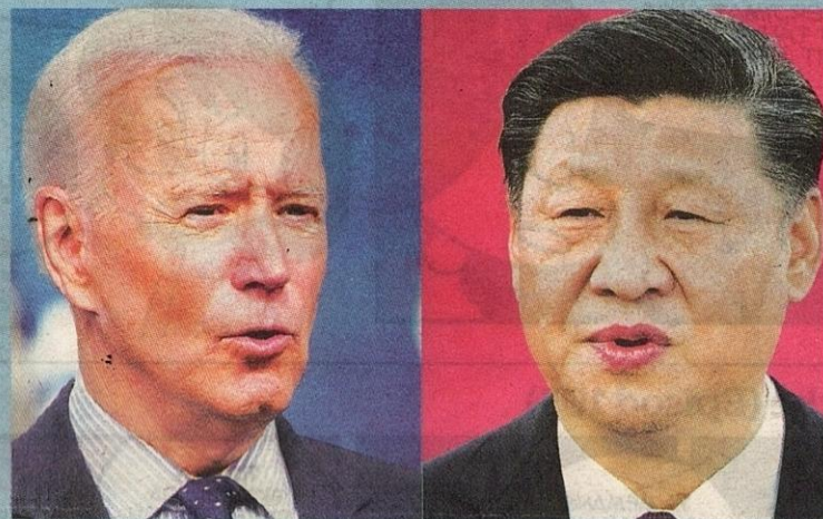
JINPING memberi amaran kepada Biden mengenai isu Taiwan. – AFP

KAPAL frigate Taiwan melancarkan peluru berpandu semasa latihan tentera di perairan dekat daerah Yilan pada 26 Julai lalu. – AFP