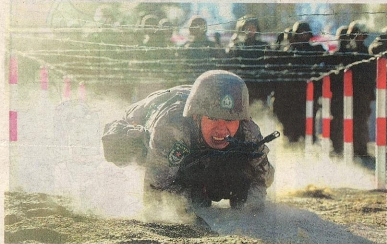
ASKAR Tentera Pembebasan Rakyat China (PLA) menjalani latihan ketenteraan di wilayah Xinjiang pada 4 Januari 2021. – AFP