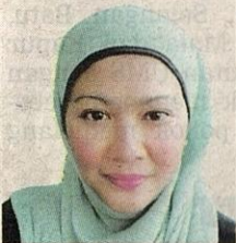
Pensyarah Kanan, Fakulti Pendidikan Universiti Malaya

Berdasarkan analisis keputusan Sijil Pelajaran Malaysia (SPM) baru lalu, terdapat penurunan prestasi pencapaian bagi mata pelajaran Bahasa Melayu dan Inggeris. Malah, dalam konteks subjek Bahasa Inggeris penurunan itu sudah kelihatan sejak SPM 2020.