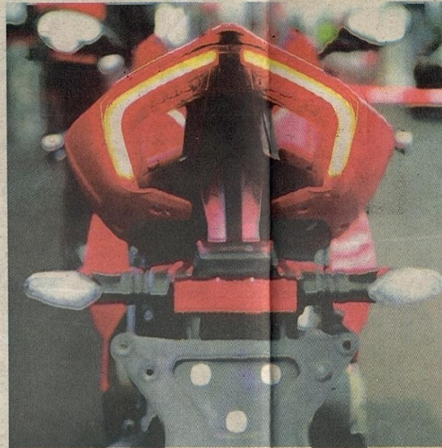
REKAAN belakang ciri aerodinamik.