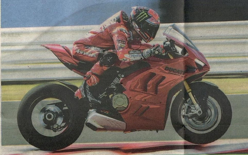
JENTERA V4S ciri prestasi.

Ia sesuai bagi kegunaan atas litar terutama untuk memecut di selekoh pantas, laluan lurus panjang serta permukaan bercengkaman tinggi