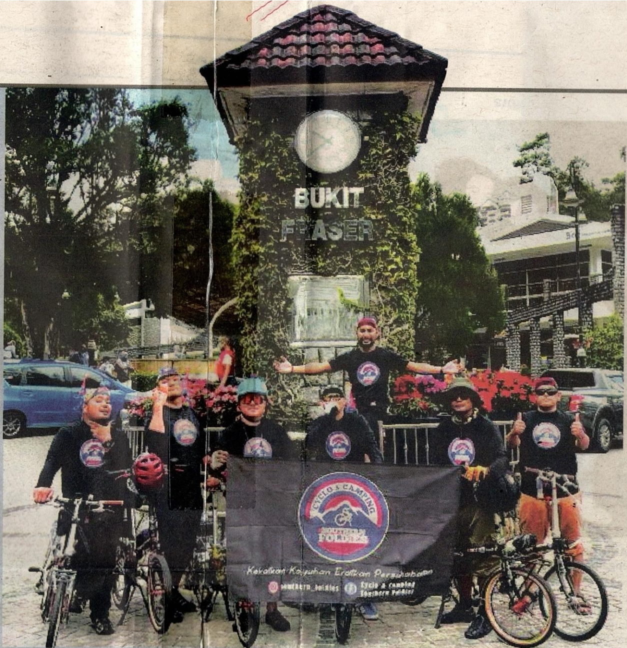
AKTIVITI berbasikal boleh menambah kawan baru sekali gus boleh berkongsi pengalaman serta ilmu baharu.