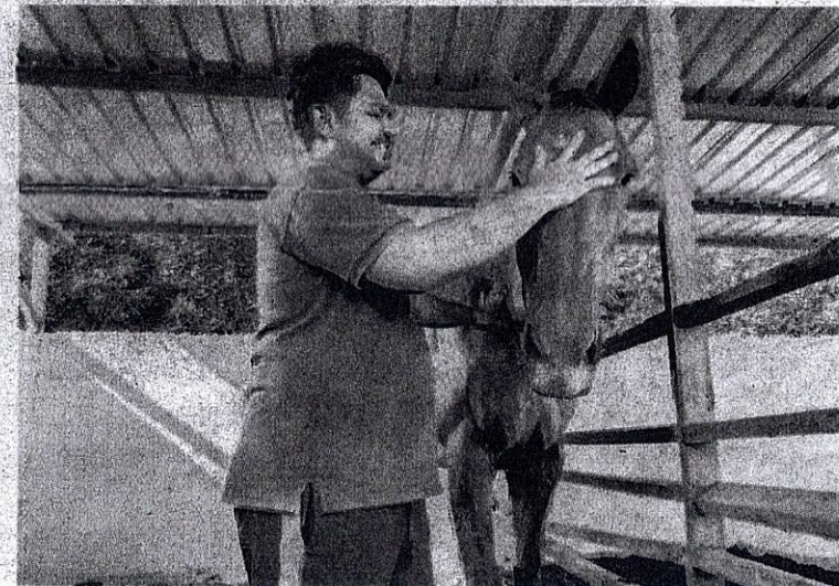
KUDA lumba ini pernah dimiliki oleh Sultan Terengganu, Sultan Mizan Zainal Abidin.