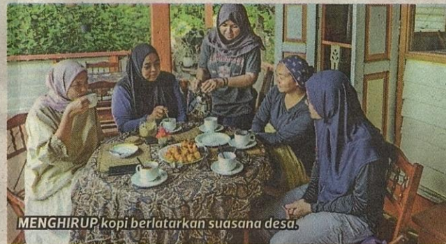
MENGHIRUP kopi berlatarkan suasana desa.