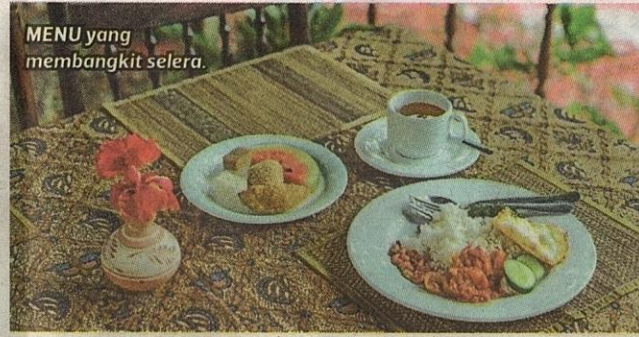
MENU yang membangkit selera.