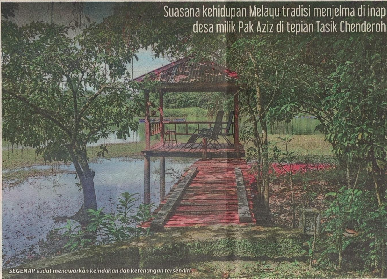
SEGENAP sudut menawarkan keindahan dan ketenangan tersendiri.

hidangan makanan Melayu tradisional, dibawa menjelajah sekitar kampung berhampiran serta digalakkan mencuba permainan tradisional seperti main congkak dan gasing.