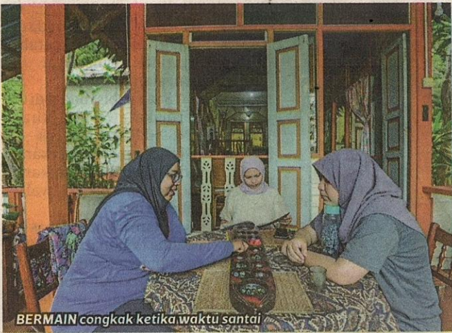
BERMAIN congkak ketika waktu santai

Apabila bunganya yang luruh jatuh ke dalam tasik, bunga putat terapung dan permukaan air tasik