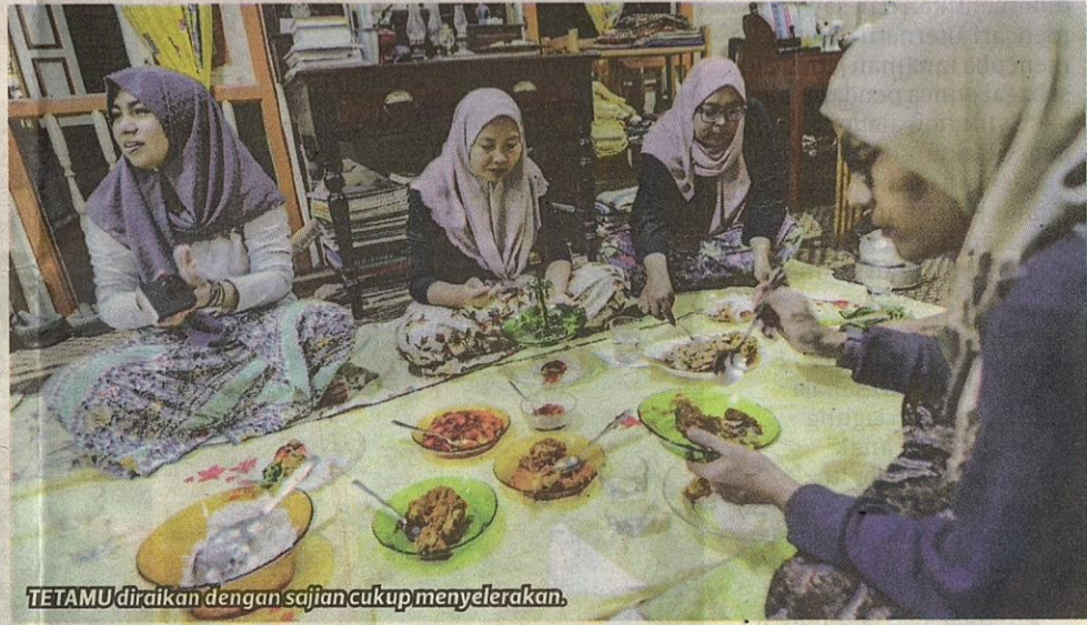
TETAMU diraikan dengan sajian cukup menyelerakan.

Beliau turut mempelajari cara membuka dan memasang semula rumah kayu lama daripada tukang kayu tempatan dan kos setiap rumah kayu lama yang dibeli bernilai RM60,000 termasuk upah pengangkutan, membuka dan memasang semula. Ia mengambil masa kira-kira empat bulan untuk dibina semula bagi sebuah rumah kayu.