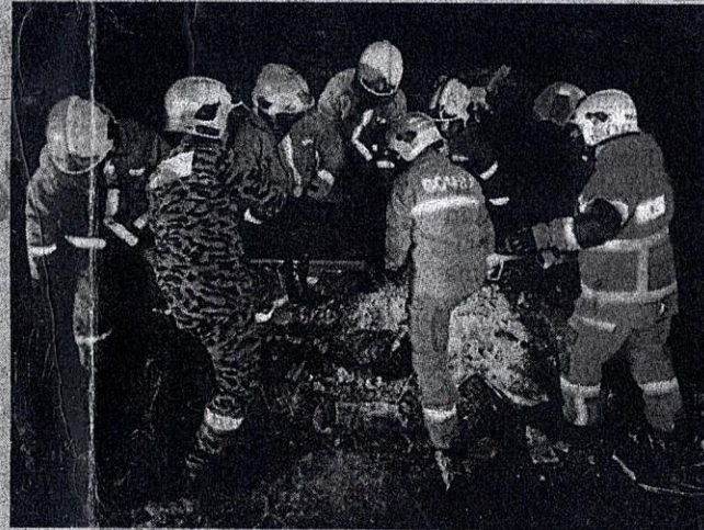
ANGGOTA bomba mengeluarkan mayat lelaki yang maut dalam kemalangan di Kilometer 408.4 Lebuhraya Utara-Selatan arah selatan, berhampiran Lembah Beringin.

tan bermuatan papan tanda. Terdapat seorang lelaki tersepit dalam treler dan mangsa disahkan meninggal dunia.