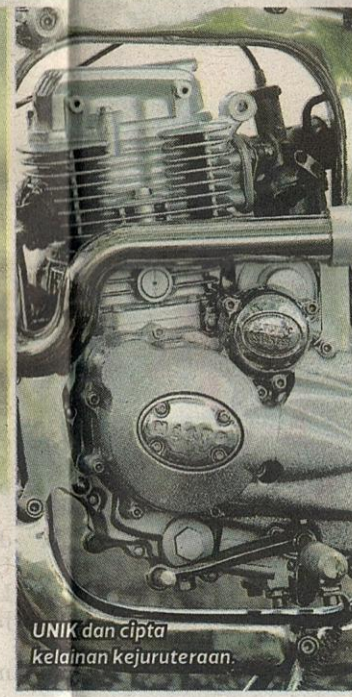
UNIK dan cipta kelainan kejuruteraan.