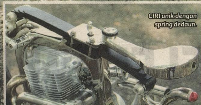
CIRI unik dengan spring dedaun.