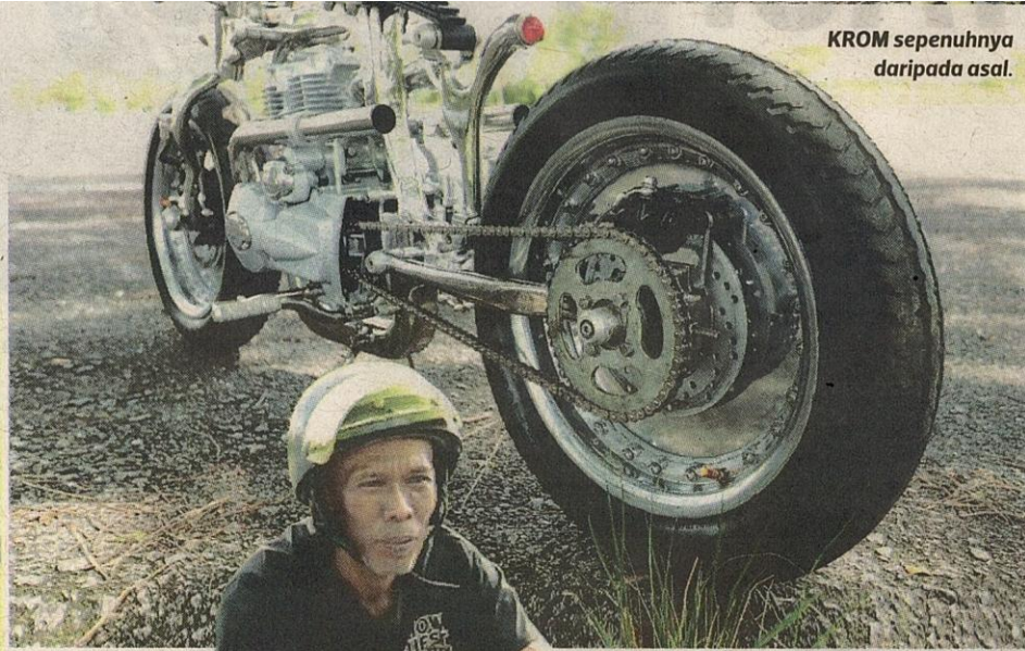
KROM sepenuhnya daripada asal.

itu dimulakan pada awal 2020 namun Perintah Kawalan Pergerakan (PKP) dikenakan sedikit sebanyak memberi cabaran tersendiri, terutama untuk mendapatkan bahan keluli, gas dan material untuk dibangunkan.