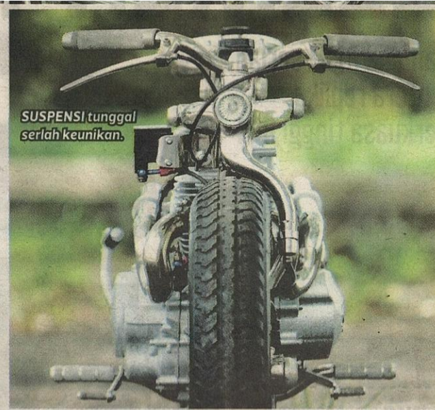
SUSPENSI tunggal serlah keunikan.

“Selain mendapat idea daripada pelbagai sumber, setiap motosikal kustom yang dihasilkan mestilah lebih baik daripada yang sebelumnya,” katanya yang