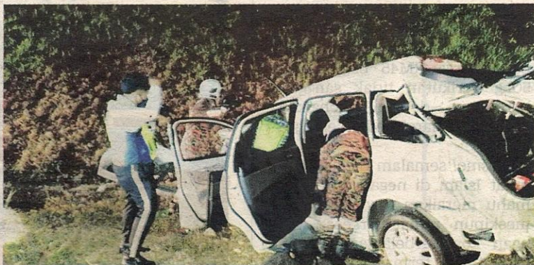
ANGGOTA bomba membantu mengeluarkan mangsa kemalangan membabitkan dua kenderaan kelmarin.

“Kesemua mangsa yang berusia antara lapan hingga 47 tahun itu mengalami kecederaan