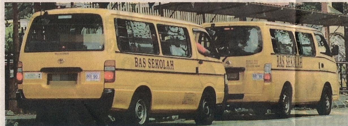
Penyusaha bas berdaftar sekurang-kurangnya dilindungi insurans jika berlakunya kemalangan. (Foto hiasan)

"Tidak susah untuk mendapatkan permit perkhidmatan bas yang berdaftar. Ambil tahu bagaimana caranya, daftarlah dan lakukan dengan betul. Bagi ibu bapa kita perlu sentiasa beringat keselamatan anak tidak boleh dikompromi," katanya.