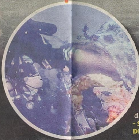
PENEMUAN pesawat itu berdasarkan rekod peperangan, kajian mengenai bangkai pesawat dan beberapa saksi.