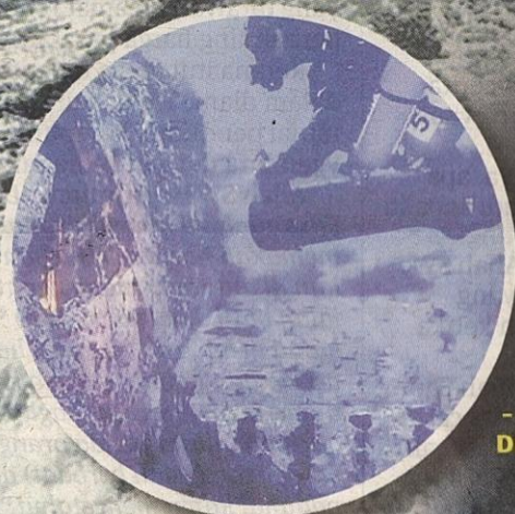
PESAWAT Martin Baltimore ditemukan mempunyai keretakan di sepanjang fuslaj dan bahagian kecil sayap kirinya hilang.