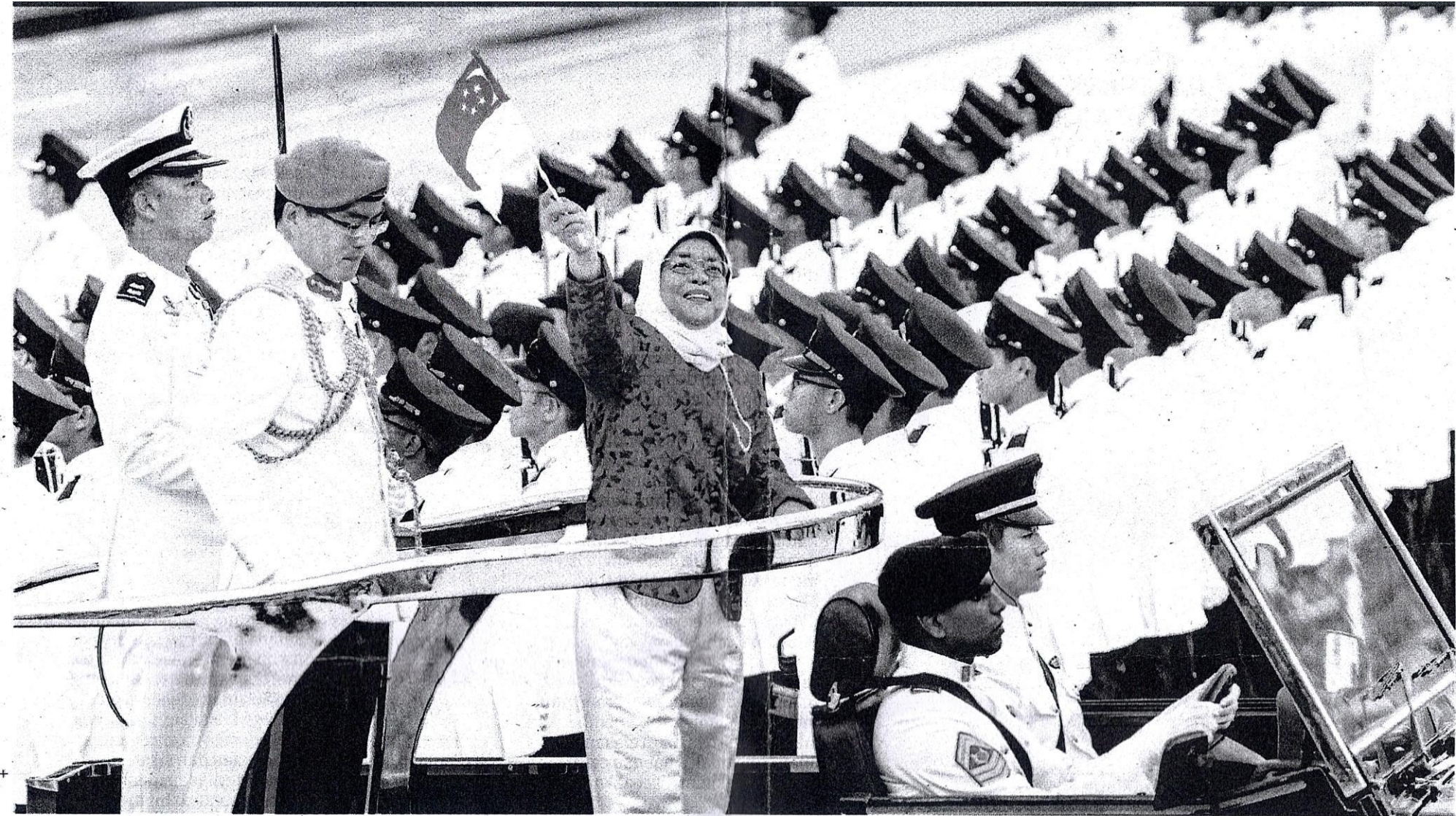
HALIMAH mengibarkan bendera semasa sambutan Hari Kebangsaan ke-54 di Singapura, 2019.