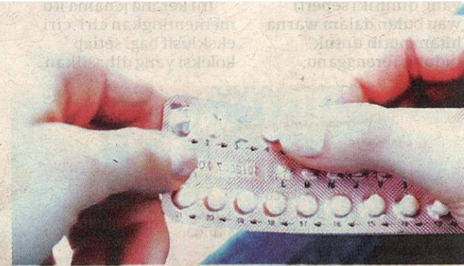
BOLEH ambil ubat pil perancang dua bulan sebelum jangkaan tarikh berangkat ke Tanah Suci bagi menguji keberkesannya.

"Alhamdulillah dengan izin-Nya, haid berhenti